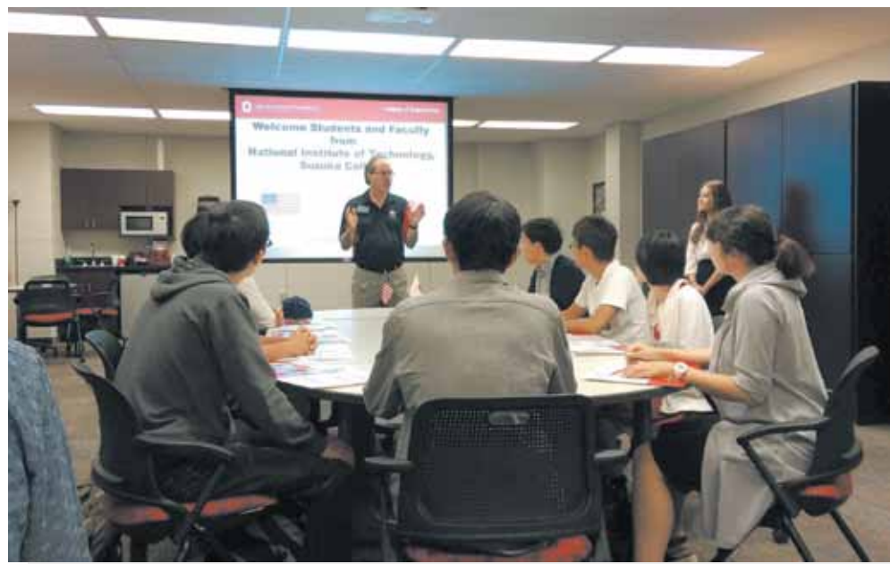
オハイオ州立大学研修