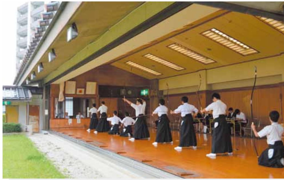
高専体育大会-弓道