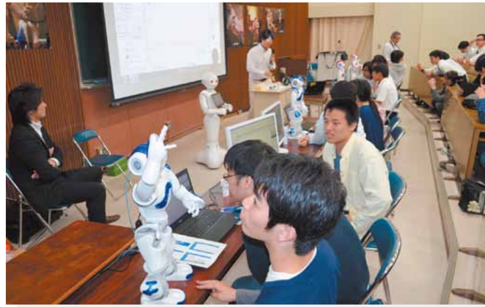
ロボット人材育成事業