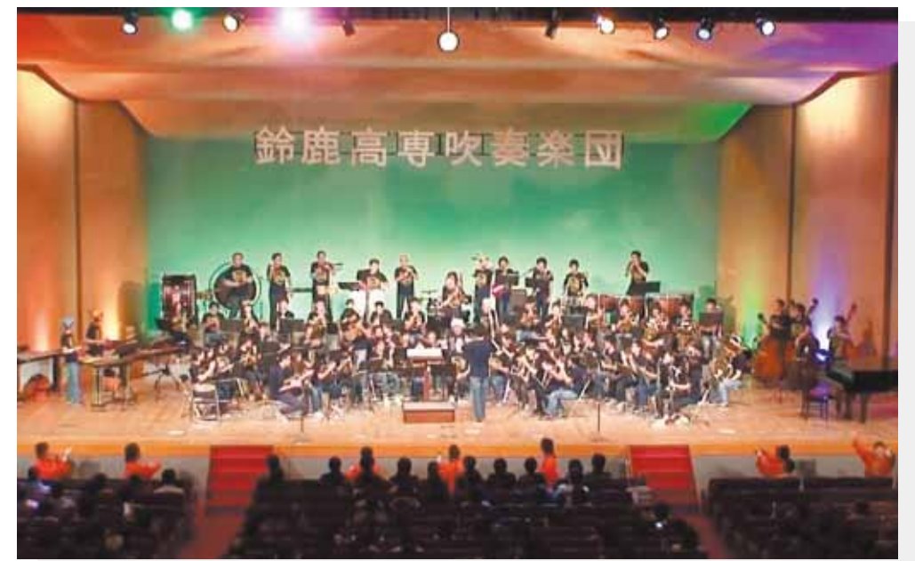
第50回 音楽部定期演奏会