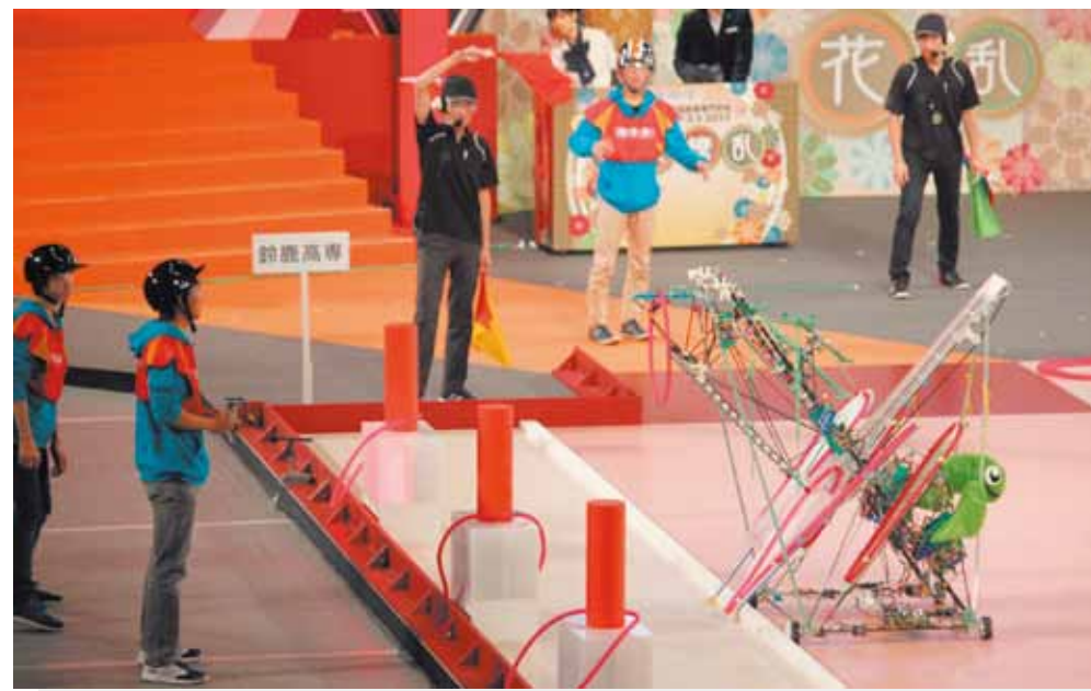
高専ロボコン全国大会