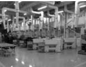
クリエーションセンター 平成25年4月完成