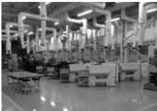
クリエーションセンター 平成25年4月完成