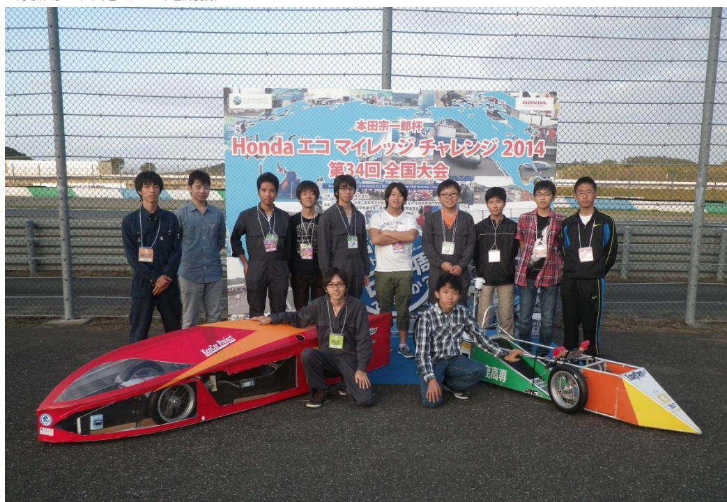
Hondaエコマイルレッジチャレンジ2014 (予選7位、決勝13位)