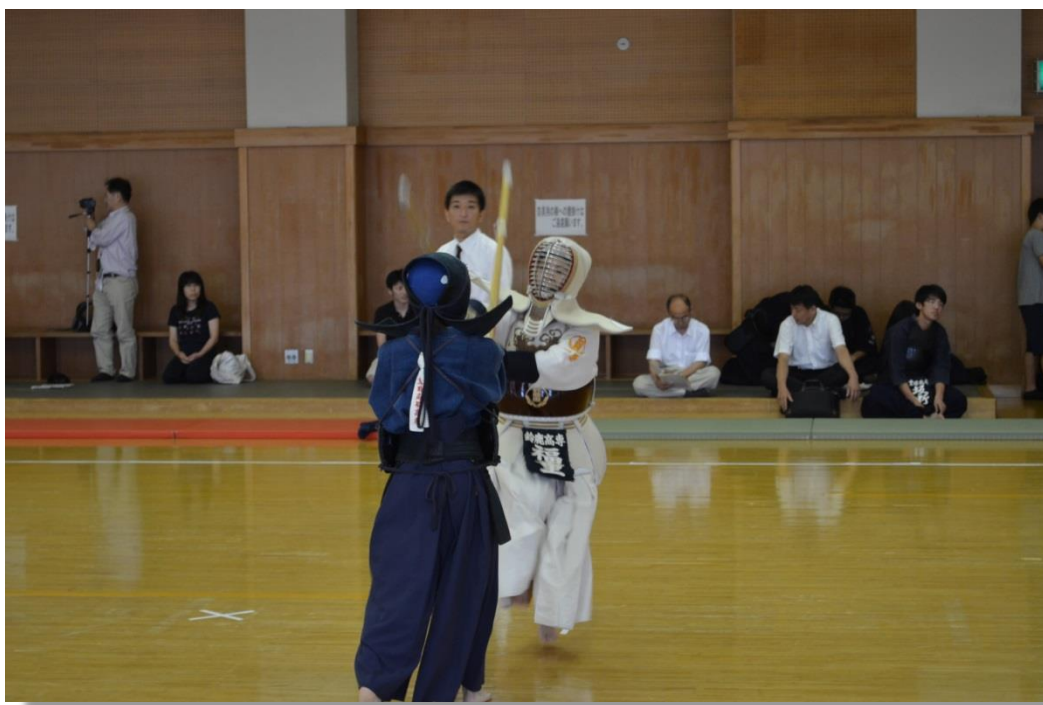
高専体育大会 (剣道女子 13年連続優勝)