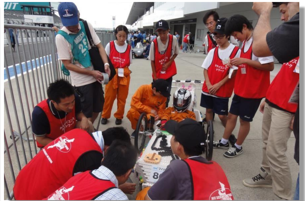
Ene-1 GP全国大会 (中学生部門優勝等7賞)