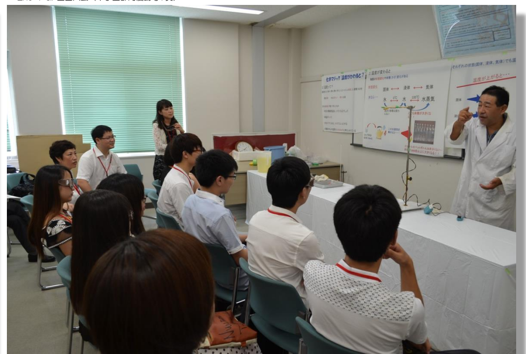
常州情報職業技術学院来校 (化学実験)