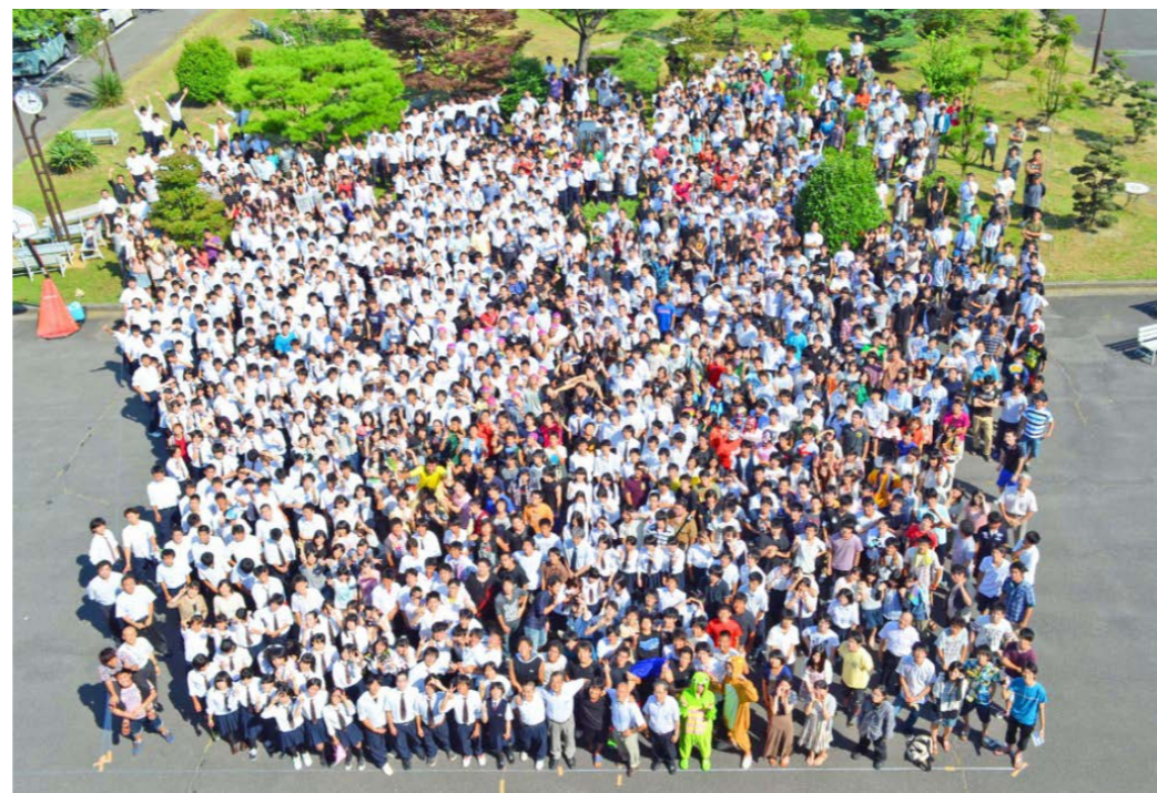
学生・教職員一斉集合