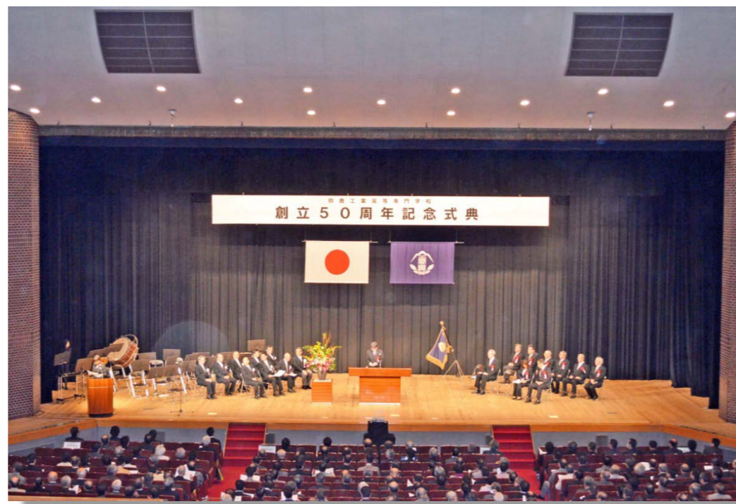
創立50周年記念式典