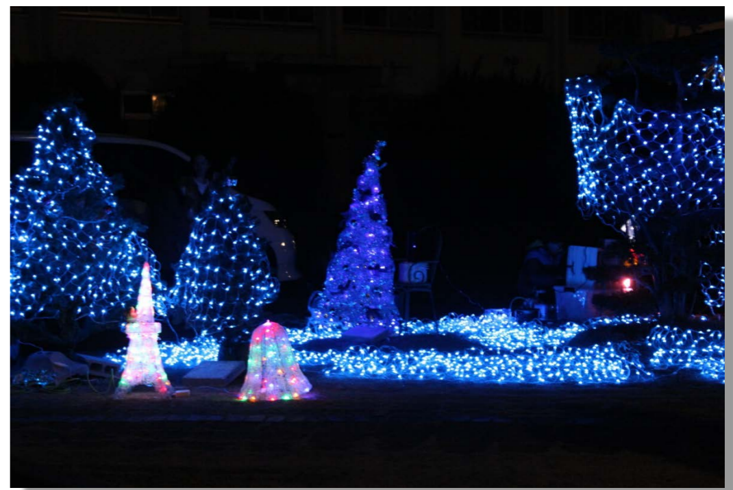
クリスマスイルミネーション