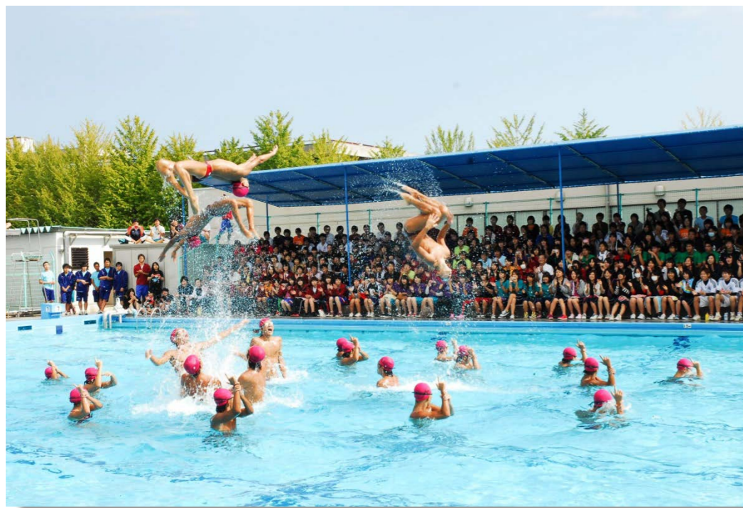
ウォーターポリス