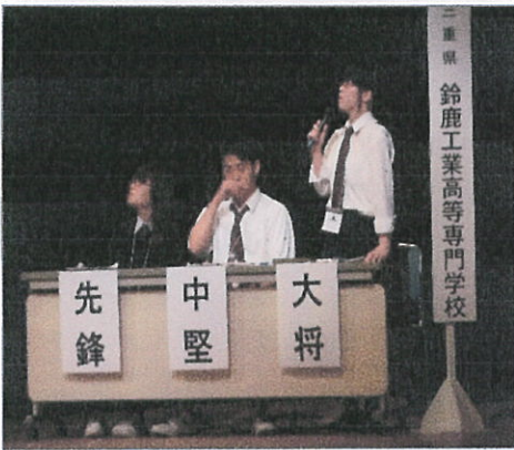
鈴鹿高専文芸部チームの活躍 (平成27年度 盛岡短歌甲子園)